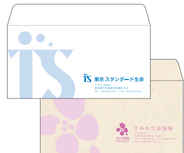
(クワエなし+指定色)