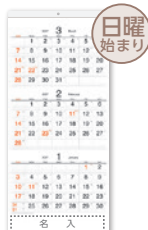
H-300 メモ付・シンプル 3ヶ月文字月表