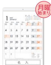
H-2100 メモ付・シンプル 文字月表