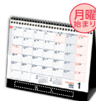
H-69 メモ付・シンプル デスクカレンダー